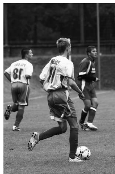
BYLE DO BRAMKI