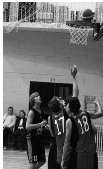
WPADNIE CZY NIE WPADNIE?