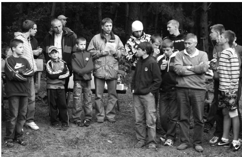
ZJAZD MINISTRANTÓW I LEKTORÓW.